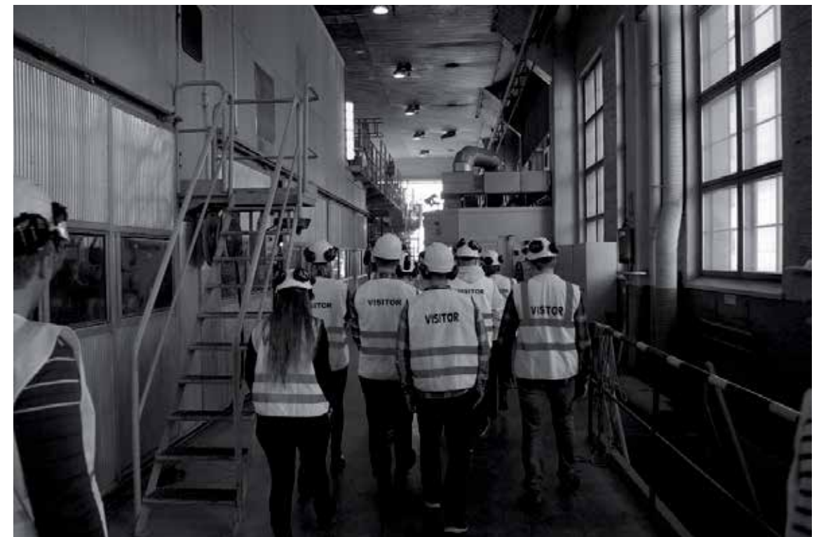
Turvallisuus ennen kaikkea. Takon kartonkitehdas on useampaan kerrokseen rakennettu tiivis paketti.

Päiväkahvit siirryimme juomaan aivan tehtaan viereen Metsäkeskukselle. Ilmapiiri oli valtion laitokselle ominainen. Metsälioppilaita hemmoteltiin paikallisen elinkeino- ja asiakaspalvelupäällikön esiintyessä