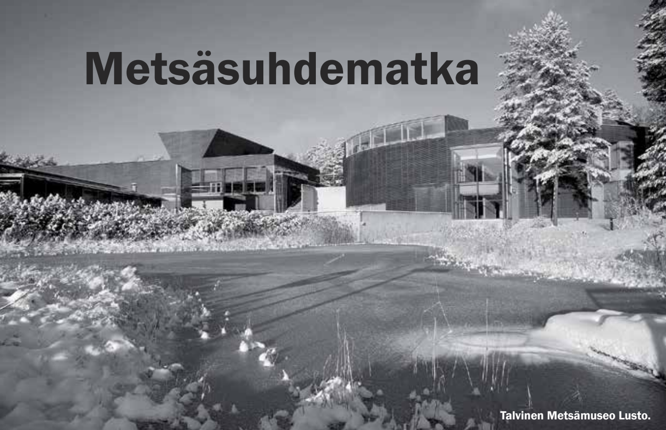
Talvinen Metsämuseo Lusto.

TEKSTI Eetu Punkka