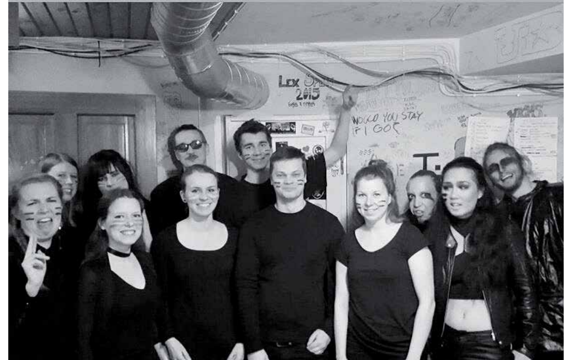
Speksibändi täpinöissä backstageella ennen ensi-iltaa.

⇒ Speksiin tarvitaan joka vuosi taitavia opiskelijoita sekä auttavia käsiä! Jos kiinnostuksesi heräsi, ota yhteyttä tuottajat.viikkispeksi@gmail.com .