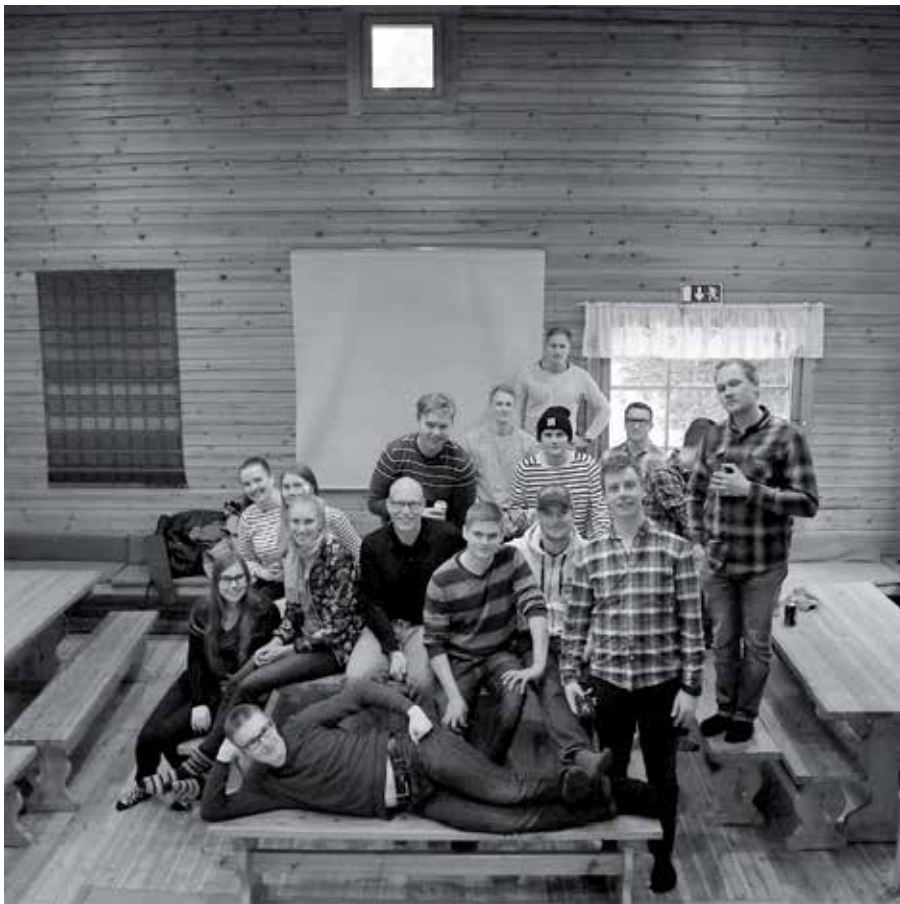
Hyvinkään perukoilla sijaisi kaikkien jännityksellä odottama partiolaisten tupa.