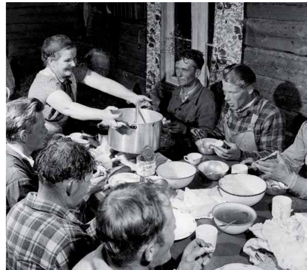
Uittomiehet aterialla 1953. Hernerokka toimii aina.