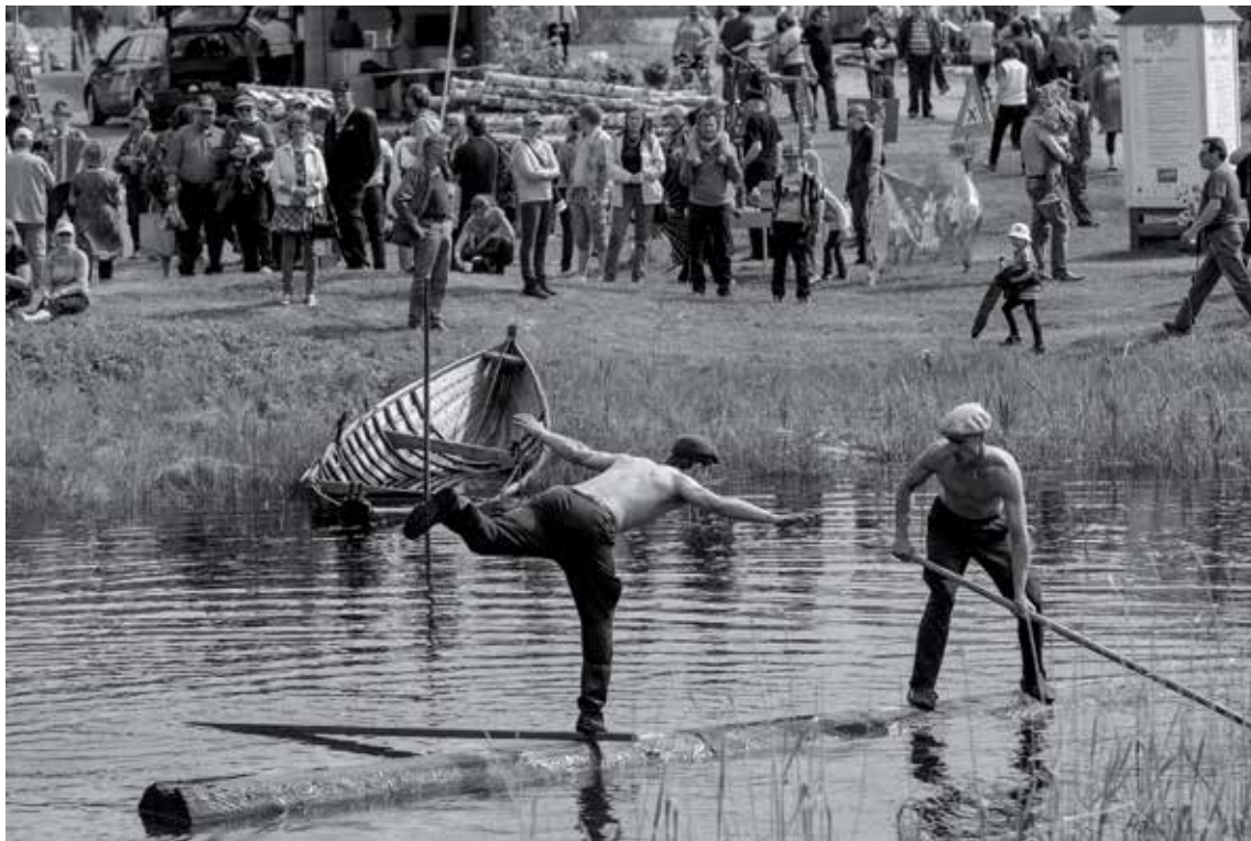
Tukkijätkät Metsäkulttuuripäivillä. Tänä vuonna tämä Luston suurin tapahtuma järjestetään 16.-18.6.

Tulevilla metsäpäivillä tullaan näkemään siis jossain muodossa näyttelyä meidän metsäsuhteestamme. Sen lisäksi ensi kesänä Lustossa työskentelee toinenkin forsti viime vuoden yhden allekirjoittaneen lisäksi. Lusto pitää sisällään valtavasti alan tietoa, johon ei meillä yliopistossa törmää missään. Kuka tietää esimerkiksi vanhimpien metsänhoitajaopiskelijoiden salaisesta tervehdyksestä? Et voi tietää! Tule ihmettelemään Lusto kesällä Punkaharjulle viileiden roadtrippien tai hikisten kesätöiden lomassa!