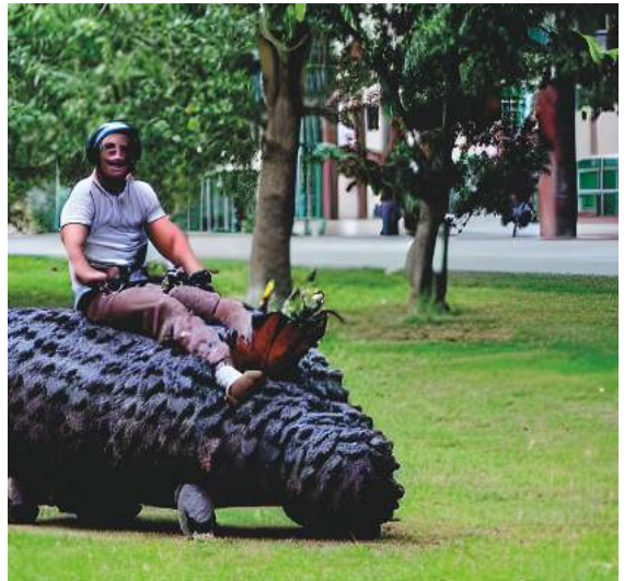
Background AI kuva: "A man riding large maggot at the university campus."

Professori ei ollut valmis luopumaan toukastaan, joten hän alkoi väitellä rehtorin kanssa. Lopulta hän ehdotti kompromissia: "Miksi emme yhdistäisi voimiamme ja kehittäisi ympäristöystävällistä kotelokoppaista kuoriaista, jolla voi ratsastaa?"