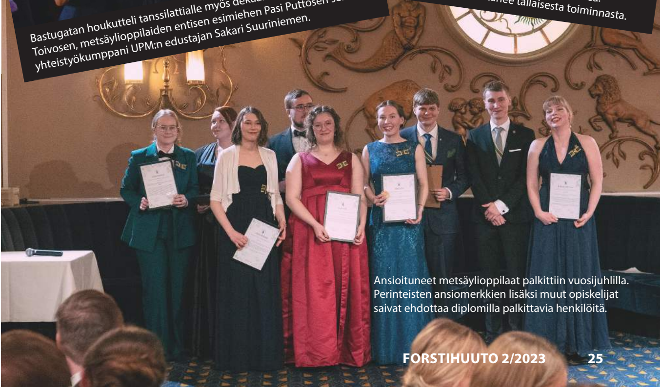
Ansiotuneet metsäylioppilaat palkittiin vuosijuhlilla. Perinteisten ansiomerkkien lisäksi muut opiskelijat saivat ehdottaa diplomilla palkittavia henkilöitä.