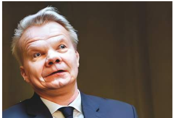
Background AI kuva: "Sauli Niinistö giving speech to forestry students about the dangers of alcohol."

Toivon, että te kaikki olette vastuullisia alkoholin käytössänne ja osaatte pitää hauskaa ilman liiallista juopottelua. Ja joskus voi olla