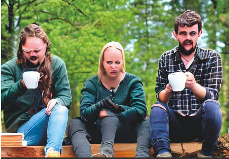
Background AI palvelulla tuotettu kuva, joka on tehty avainsanoilla "Three forestry students sitting in a students club room"