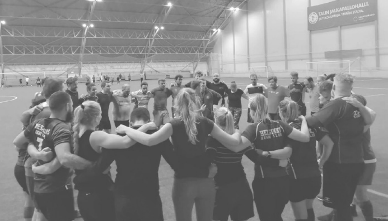
Alkeiskurssilaiset sulautuivat hyvin vanhojen pelaajien joukkoon.