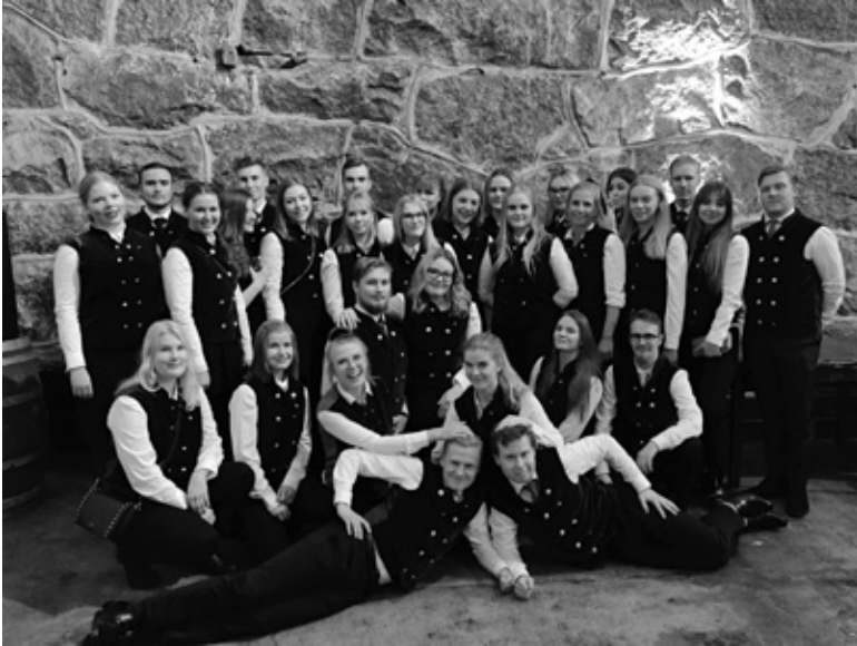
Kurssi-112 ei ole enää taimia