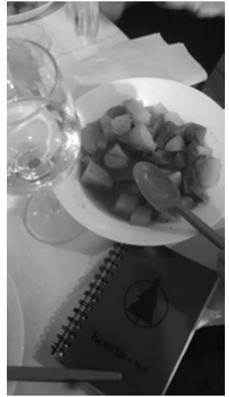
Hirvisoppaa ja viintä