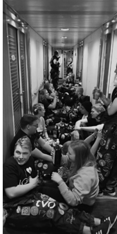
Menoa, meininkiä, darraa ja uutta nousua Jekkuaamiaisella.

Vaikka risteily onkin alkujaan lanseerattu lähinnä biotieteilijöille, on mahtavaa, että myös metsäläiset ovat löytäneet tämän äärimmäisen