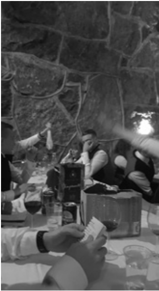
Kuvamateriaali pöytäjuhlista ei ollut kaksista