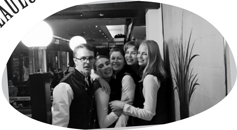
Hämärä muistokuva vuoden 2019 iltakierrosten hilpeistä laulajista.