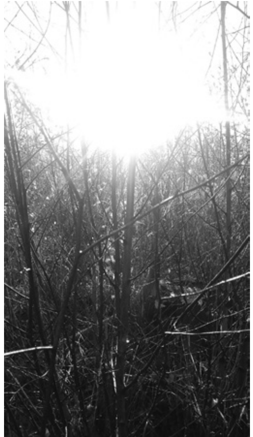
Mittaamisen sivussa voi dokumentoida myös häivähtäviä luonnonilmiöitä kuten auringonvaloa.

Ajetaan me liisarilla mitataan ja ihmetellään hypsometrin viisarilla kysellään, koska ne hyvät säät menikään?