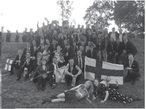
Suomen joukkueen ryhmäkuva