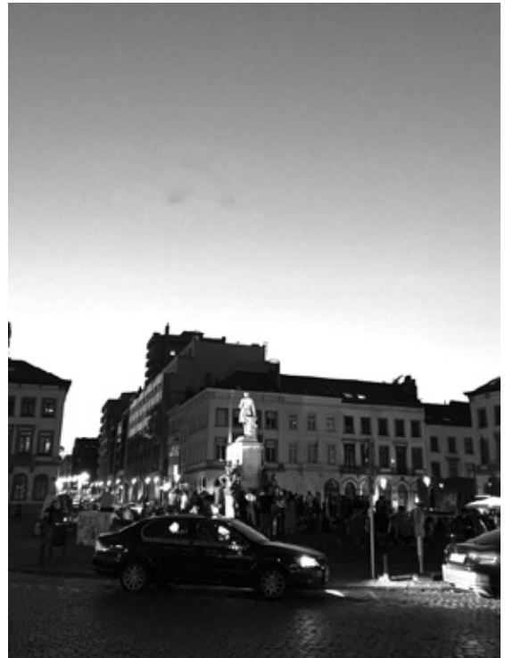
Torstai-illan viettoja Euroopan parlamentin edustalla

Harjoitteluni aikana hoidin päivittäin hallinnollisia asioita, kuten sähköpostia ja logistiikkaa. Lisäksi työnkuvaani liittyivät vaihtelevat teemat: tehtävät mepin valiokuntatyöskentelyyn liittyen. Erityisesti metsä- ja ympäristöasiat olivat Euroopan komission uuden metsästrategian ja LULUCF-asioiden myötä kesän aikana paljon pinnalla.