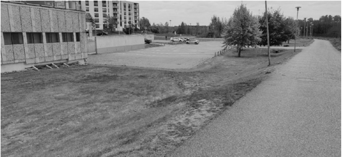
Kaunis kansallisromanttinen maisema.