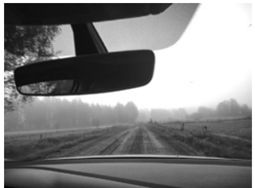
Puiden lisäksi tutuksi tulee farkkuauton penkki.