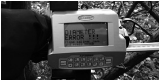
Mittasaksien toiminnan dokumentointia.