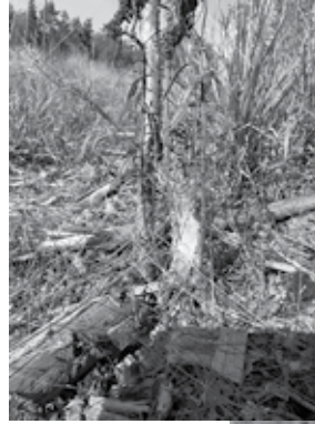
Täpläverkkoperhosen talvipesä tähkätädylle (yllä) ja heinäratamolla

Mikäli kiinnostaa päästä osaksi pitkäaikaista ekologista tutkimusta samalla keräten työkokemusta ja joulubonusta, suosittelen lämpimästi lähtemään mukaan uusia kokemuksia hankimaan. Haku syyskartoitukseen on yleensä maaliskuussa, joten kannattaa seurata tarkkaan yliopiston sähköpostilistoja kevään aikana. ■