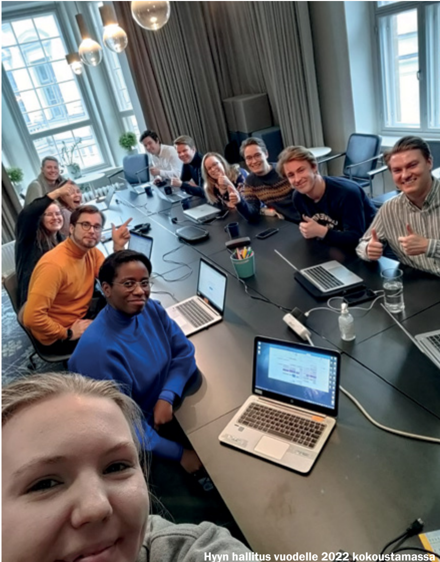
Hyyn hallitus vuodelle 2022 kokouksessa

ja valmistella niihin tulevia asioita. Talousjohtokunta koostuu edaattoreista, ja siellä esimerkiksi valmistellaan ylioppilaskunnan budjettia, päättään järjestöjen rahoituksesta ja tilojen käytöstä.