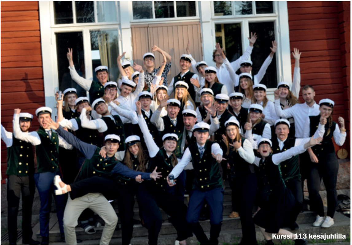
Kurssi 113 kesäjuhlilla

talkkareiden sinne haalimia puita ja vähintäänkin istutaan heidän rakentamillaan penkeillä.