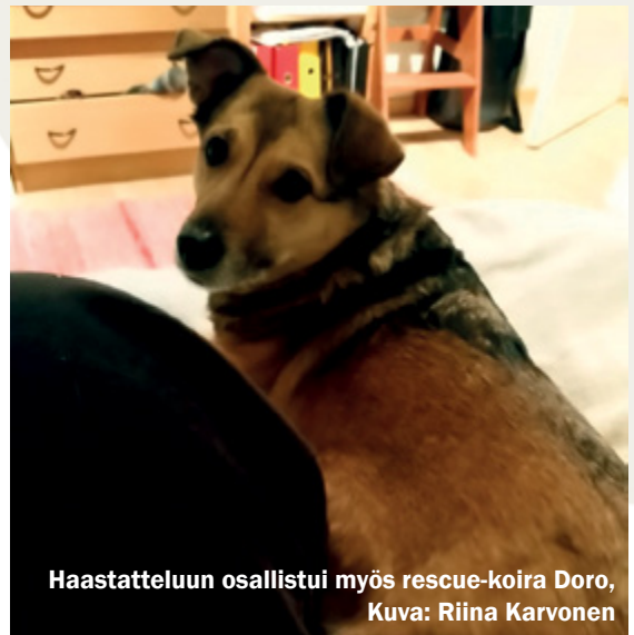
Haastatteluun osallistui myös rescue-koira Doro

”Ihmiset usein unohtavat, ettei Hyy ole kasvoiton kaikkivoipa koneisto, vaan siellä on oikeita ihmisiä töissä ja hallitus koostuu opiskelijoista. Ylioppilaskunta on olemassa opiskelijoita varten. Täytyy uskaltaa vaikuttaa, jotta siitä saadaan myös opiskelijoiden näköinen.” 🌲